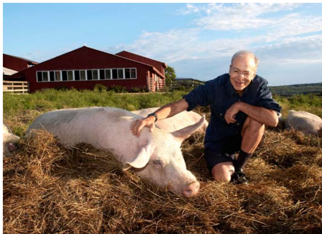
PETER SINGER Pour le professeur de Princeton, l'émancipation des animaux doit suivre celle des Noirs, des homosexuels et des femmes. L'intégrité d'un animal compte autant que celle d'un homme.

Des idées qui avancent. Cette influence se devine à certains signes comme l'attention portée à l'aquarium de tout un chacun. Les nouvelles dispositions légales suisses s'inquiètent en effet du bien-être des poissons et définissent scrupuleusement les conditions de leur mise à mort. C'est un thème typique des «antispécistes», très attentifs à la souffrance du poisson. «Ces animaux dont l'unique